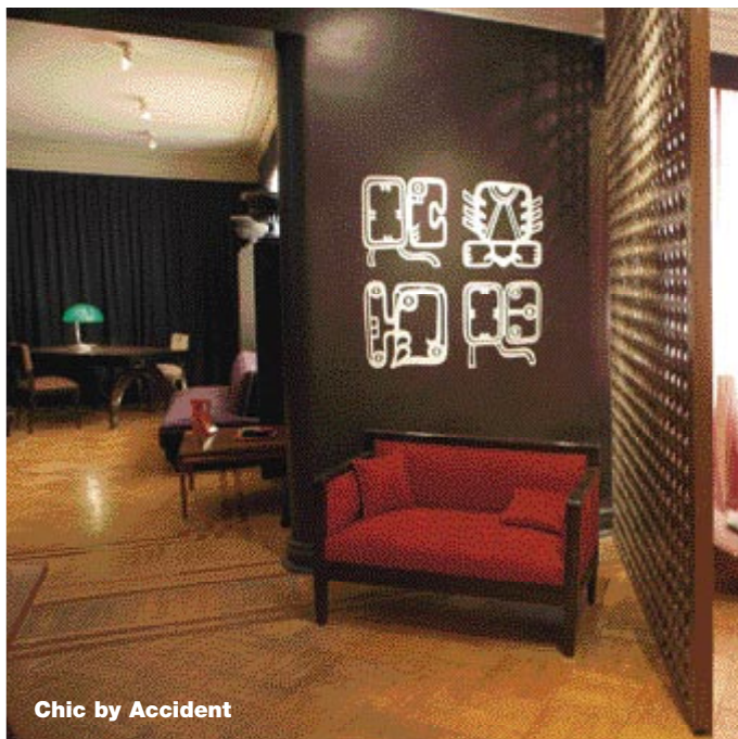
Chic by Accident

20 Motolinía, Centro Historico, Tel.: 55186369